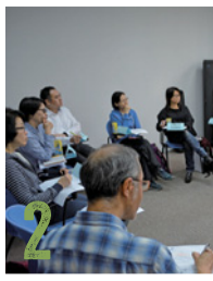
1-5. 各位教會代表輪流分享

「我們的小組由六個人開始，最初用的是民數記（上、下）的『材料包』。同時，一個七人的主日學小組也曾使用這個『材料包』。他們現在查但以理書。為了時間更加充裕，我們的小組由平日改為隔週六下午聚會，人數增至十二名，用的是路加福音（上、下）的『材料包』。教會有一個路加團，聽說我們查路加福音，他們也跟著使用這個『材料包』來查經。