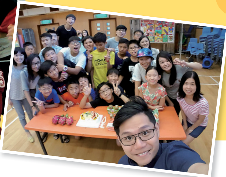
與團友合照（後排右二灰衣戴眼鏡的是本文作者）

不可叫人小看你年輕，總要在言語、行為、愛心、信心、清潔上，都作信徒的榜樣。（提前四12）