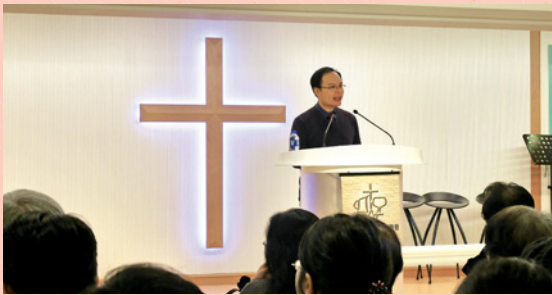
高博士講解精彩，弟兄姊妹全神貫注聆聽，沒有「釣魚」。