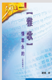
謝挺：雅歌——情牽永約（研經本）