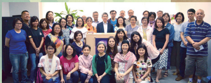
大夥兒來張合照留念。