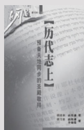
高铭谦、李锦棠：历代志上——预备天地同步的圣殿敬拜（研习本）