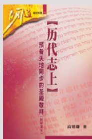
高铭谦：历代志上——预备天地同步的圣殿敬拜（研经本）