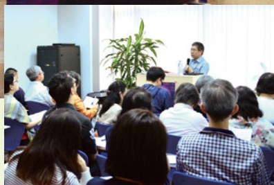
第三屆互動式研經班，共有四十位組長參加。