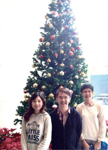
與同工在辦公室大廈大堂合照 (右一為作者)