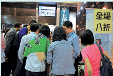
書攤也是水洩不通。