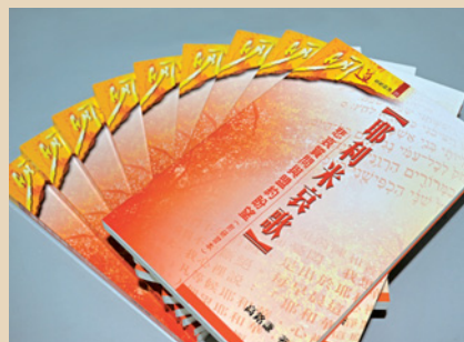
本書自2017年7月出版，連續三個月高踞本社銷售榜冠軍。