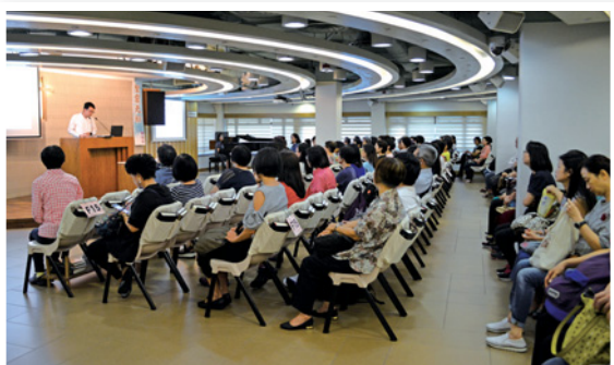
明道精讀團契北宣早