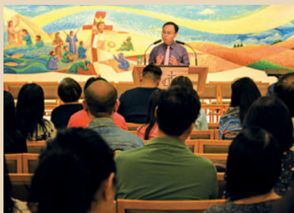
弟兄姊妹專心聆聽講解。