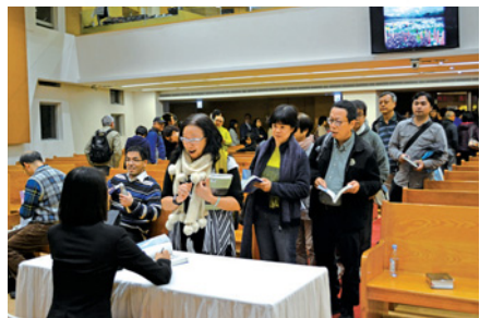
講座後的簽書會是讀者的意外收穫。