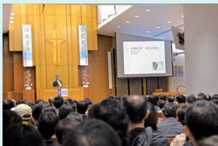
來尋找答案的弟兄姊妹坐滿「北宣」禮堂。