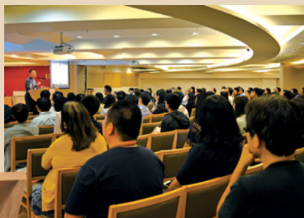
繼2016年的課程歷代志上，今次再接再厲，近180人報讀。