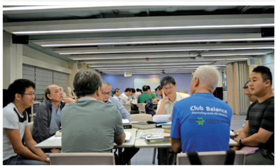
明道精讀團契北宣晚