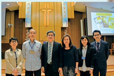
郭牧師、師母與「北宣」和本社同工合照。