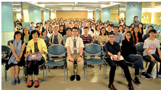
與查經組長訓練班學員合照（前排正中是作者）