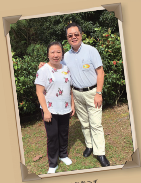
幾乎沒有吵過架的恩愛夫妻