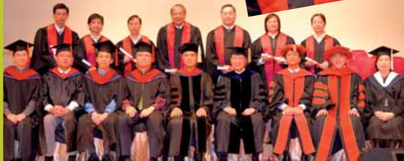
院長、全體講師、董事、 全體畢業生及詩班