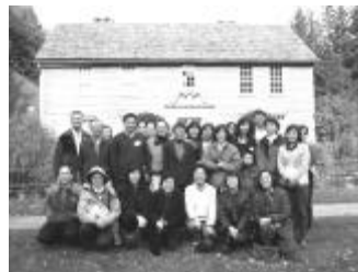
愛德華滋去世前，有七年在麻州西部服事印地安人之聚會地點