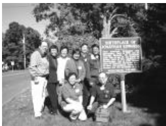
四對牧師夫妻站在愛德華滋出生地的紀念碑前留影