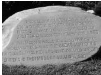
帶來北美第一次屬靈大復興華氏之名講章「罪人落在憤怒之神手中是可怕的」之紀念碑。該石標出華氏在康州傳此信息的教堂地點