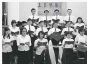
新生特輯 06 消息與代禱 10 教務處·神學體驗營 14 推廣教育中心課程 20