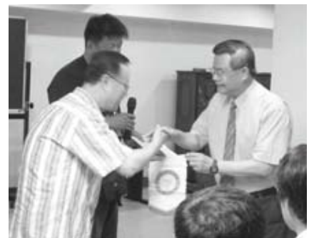
韓國教會約100多人於8月中來訪本院