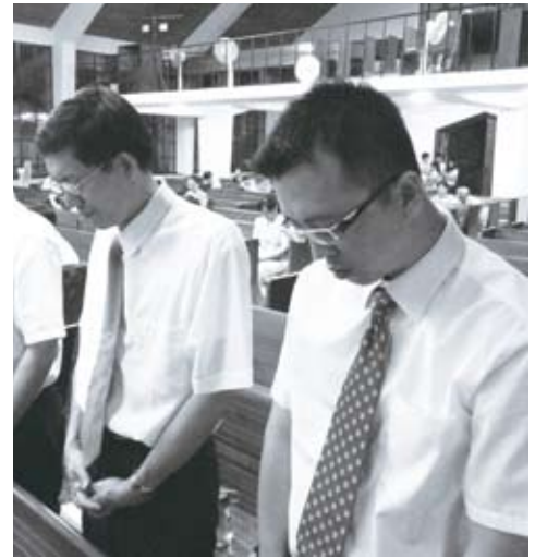
99學年新生參與新生訓練與開學典禮獻詩