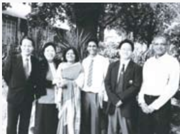
江榮義·彼得的愛主 02 劉光啟·另類士師：亞拿的兒子珊迦 08 宣教中心·華語班招生 13 校友情·浸會心 19