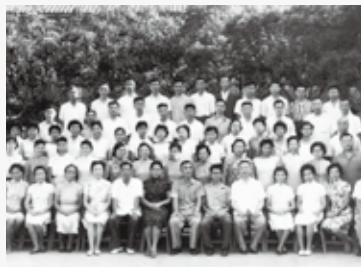
吳昶興·冠冕上的明珠 02 宣教中心·開拓植堂研討會 08 教務處·招生廣告 14 聖誕音樂崇拜 19