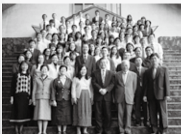
院長的話·新的異象 01 查時傑·教會史譚 (三) 08 推廣教育中心·招生廣告 12 校友情·浸會心 19