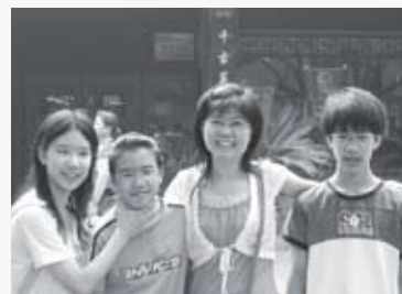
謝美玲·我唸了兩次台灣浸信會神學院 06 消息與代禱 10 2010年9-10月奉獻徵信錄 15 100學年度招生廣告 20