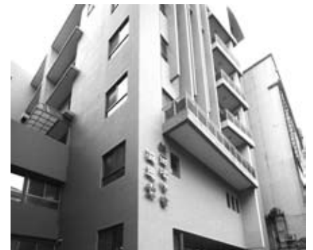
浸信會溢恩堂新堂

(補登消息) 浸信會溢恩堂於1月24日舉行獻堂感恩禮拜，感謝主！擴張祂的帳幕、使用祂的教會成為多人的祝福，求神繼續保守引領。