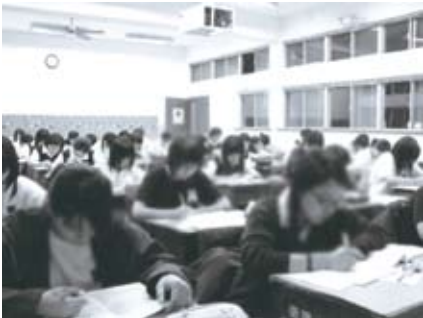
衛理女中上課情形

梅翰生又在董事會的支援下，興建了三棟共十二戶的教職員宿舍，拓建三種眷舍廚房，調整單身宿舍及加蓋工友宿舍，翻修運動場跑道，設立校園遊戲器具，改善廚房工具，甚至在她退休前興建綜合大樓，以滿足學校各方面的需要。在這當中，梅翰生最為津津樂道的建設，就是將學生宿舍從過去燒煤炭的熱水設備改為進口的鍋爐，這對校內及社區環境的衛生以及節省人力都是很大的改革。當