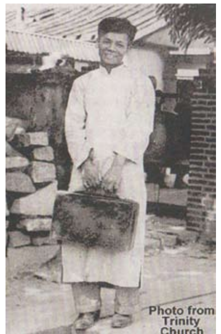
影響華人教會甚鉅的宋尚節傳教士

該會爲實爲公理宗旗下，屬英國地區的公理會教會所組成的差會，來華歷史最久，傳教地區亦廣，除致力佈道工作外，醫療宣教、教育宣教亦十分注重。