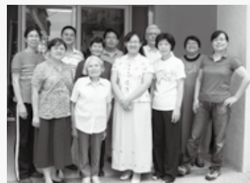
張宜佳·祂是我的主，我的主宰 06 消息與代禱 10 查時傑·教會史譚（三）14 100學年度招生廣告 20