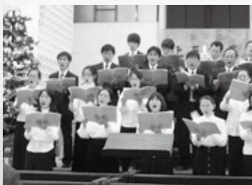
院長的話 01 2011年春季聖經講座廣告 08 推廣教育中心·招生廣告 12 校友情·浸會心 19

屬地的學校須按著部訂的標準，作成相對應的計劃，準備自己接受評鑑，屬靈的學校更須按著神的標準做好準備，迎見神的評鑑。「神啊，求你鑒察我，知道我的心思，試煉我，知道我的意念，看在我裡面有什麼惡行沒有，引導我走永生的道路。」（詩139: 23-24）