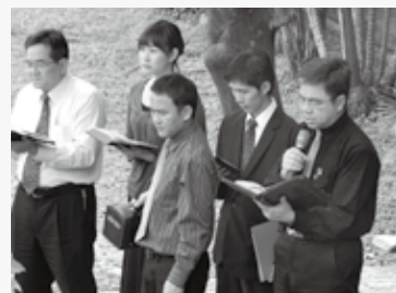
好書預告·釋經實用手冊 05 消息與代禱 10 課程廣告·推廣教育中心 14 課程廣告·暑期神學進修學分班 20