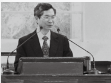
院長的話 01 阮寶珠·蒙福的試煉路 06 課程廣告·開拓歷程的實務探討 11 2011年3-4月奉獻徵信錄 15

傳承的工作不是一件易事，教會的傳承常出現困難，處理不好必帶來傷害，這是一件必須學習的功課，「傳」的人要認清自己的責任，也要避開不放心的試探，為承續的人禱告，出於神的，神必負責，「承」的人更要謙卑受教，尊重智慧的勸告，深信在神的引導下，傳承才能順利完成。