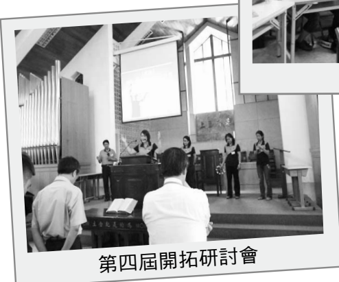
第四屆開拓研討會