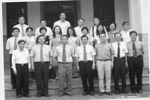
客神、浸宣、衛理與本校四校聯誼