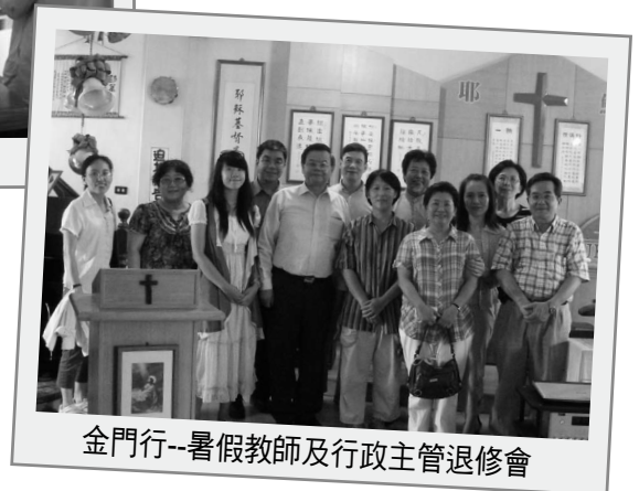
金門行--暑假教師及行政主管退修會