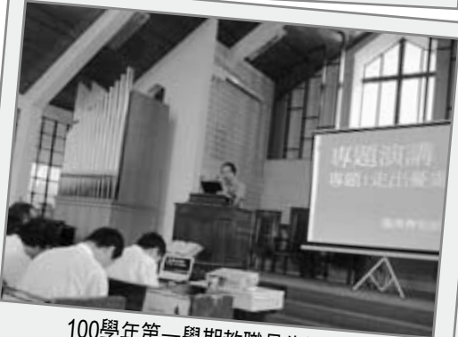
100學年第一學期教職員生退修會