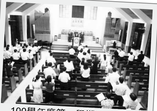
100學年度第一學期開學典禮