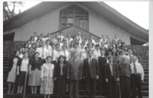
▲浸神全體師生祝福您聖誕快樂，新年蒙福。