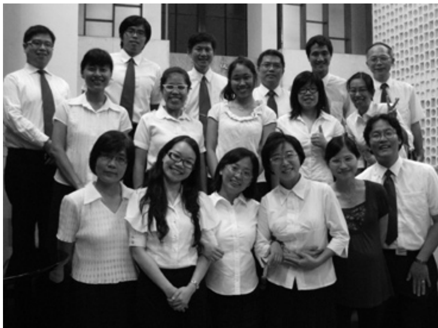
開學一年級新生獻詩

我願意自己能在等候神差遣的過程中，先將自己預備好成為合用的器皿；好叫神的呼召一來到，我能夠立即跟上主的腳步、完成祂託付於我的。