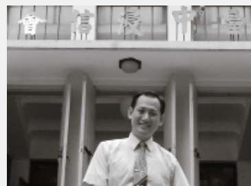
紹德基 · 感恩的心 06