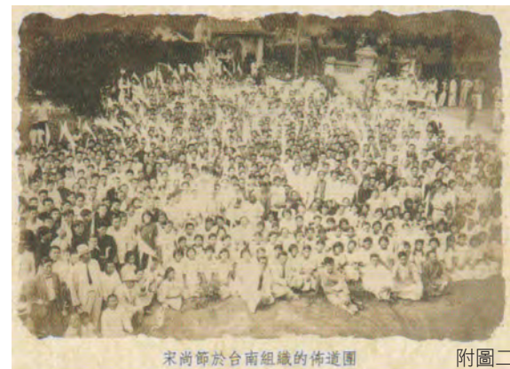
宋尚節於台南組織的佈道團