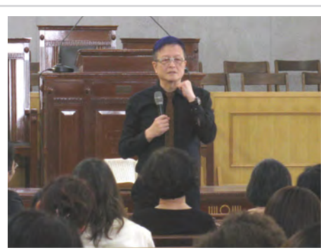
第六屆開拓植堂研討會