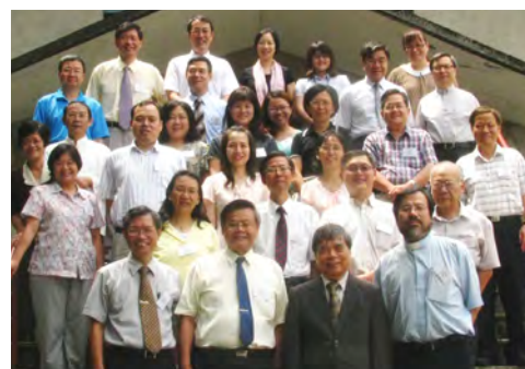
客神、浸宣、衛理與本校的四校聯誼