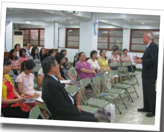
101學年度第一學期教職員生退休會