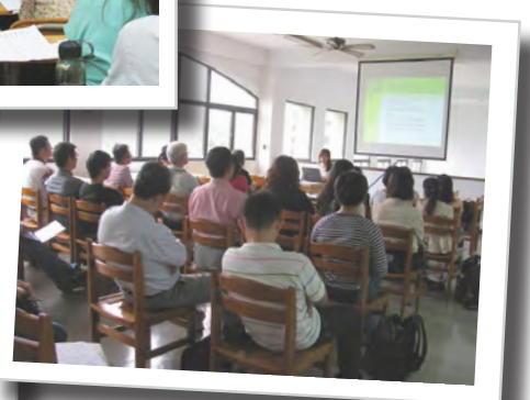
新生訓練-圖書資訊查找