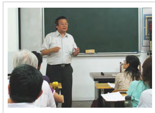
新生訓練-課程簡介