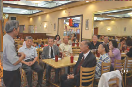
圖1 休士頓浸會同工獲頒紀念章 圖2 訪問杭院長 圖3 加州浸聯會聚餐 圖4 訪問DBU 圖5 達拉斯校友聚餐 圖6 訪問金門神學院 圖7 加州校友獲頒紀念章 圖8 訪問休士頓大學 圖9 訪問裴斐老師 圖10 洛杉磯校友會聚餐