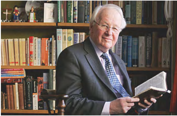
新約學者斯托得 (John Stott)

體」。換言之，保羅言下之意並非單單強調五重職事，而是更強調一個健全教會的建立，乃是聖徒被「成全」（καταρτισμὸν perfecting，原文意為修補，源自於醫學上將脫臼的骨頭重新接上之意）， 4 以及「各盡其職」（εἰς ἔργον διακονίας work of the ministry）之後的結果。