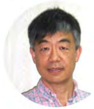
文 / 羅競知 牧師