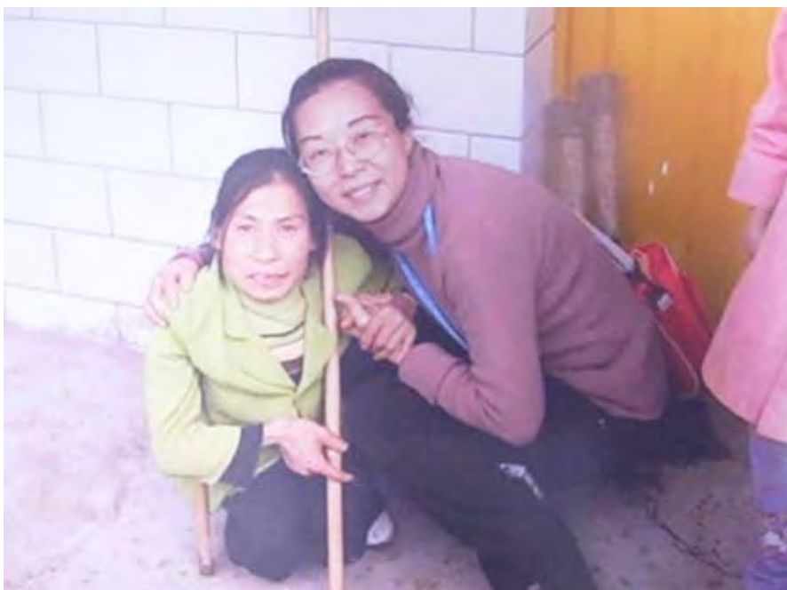
▲ 圖片為作者與丈夫至貴州進行醫療宣教及關懷活動