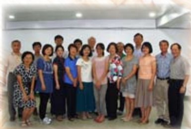
暑期學分班同學合影