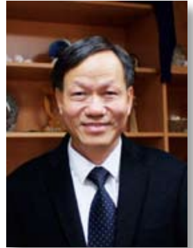
文 / 江榮義 牧師