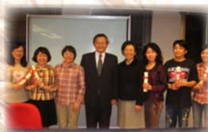
教牧關顧與心靈輔導課程-結業典禮