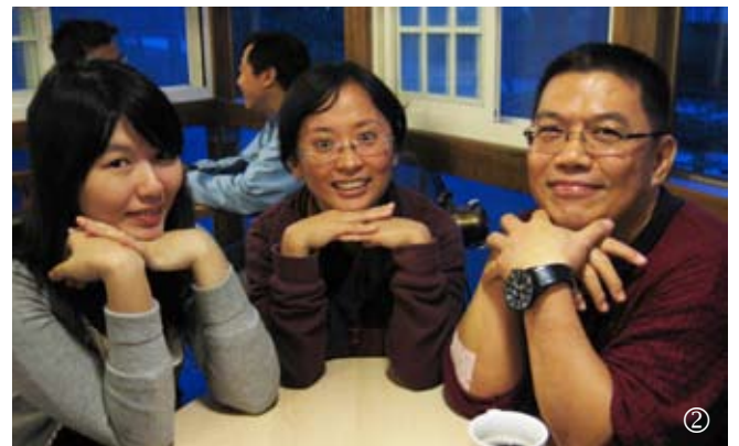
圖一 作者(第一排左二)與班級合照 圖二 作者(第一排左二)與同學

再隱藏；你眼必看見你的教師。你或向左或向右，你必聽見後邊有聲音說：這是正路，要行在其間。」當時看到這一段經文讓我有點震驚，但心裡更加確信這是神指引的道路，而我也於99年9月進入學校就讀一年制神學先修班。