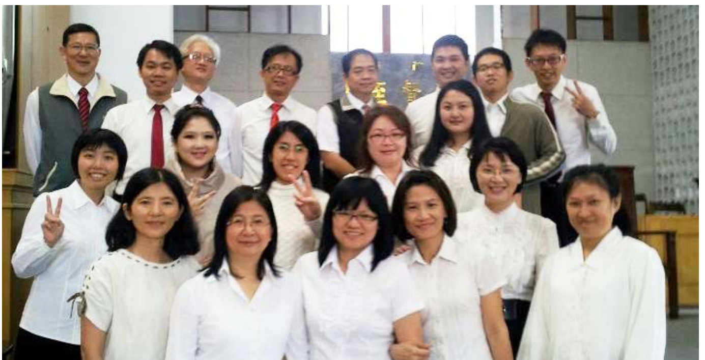
▲ 作者(第二排右一)與班上同學合照

但是我發現耶穌在我身上做出另外一條生命的樣子，這是在我以前的經驗裡面沒有的。因為我自己的家庭前三代沒有人是重生的基督徒，所以沒有人告訴我，原來人可以這樣活，可以不要那樣活。這個對我來說：過去的人生觀、價值觀、知識和經驗，有了一個新的判準、新的眼光。我知道我需要，把我一生投注在一個更明確、更有價值、更美善、更真實的領域中，這個東西就是基督教，就是耶穌這一條道路、真理、生命。我到今天認識耶穌已經滿十二年，我知道耶穌已經呼召我讀神學院，在神的心意中親自建造我、造就我，超過我所求所想。讓我經歷神奇妙的作為，我要更多傳講耶穌，傳講十字架的救恩。繼續跟隨祂、將我的生命交給祂、感謝讚美主。