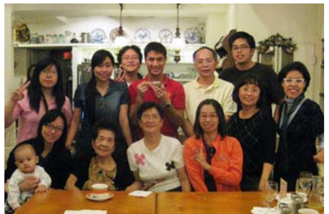
▲ 作者(第一排右二)與同學聚餐

間之後，我開始參與教會服事，這是神塑造我生命的另一個階段。在服事的過程中，肉體的軟弱、驕傲、忌妒等性格一一浮現，例如：逃避及抱怨服事的壓力、不願意付上代價又羨慕他人的服事、個人情緒影響到教會服事等，教會的小組長，也曾經決定要暫停我教會的服事。後來在職場上，我需要教導一位新進同事工作事務，不知為何他對我的態度非常無禮，原本想帶他更快熟悉工作內容的我，只想與他敬而遠之。但這件事情，也使我領悟到原來抱怨會失去祝福，神原本想藉由許多事情帶領我學習並賜下恩