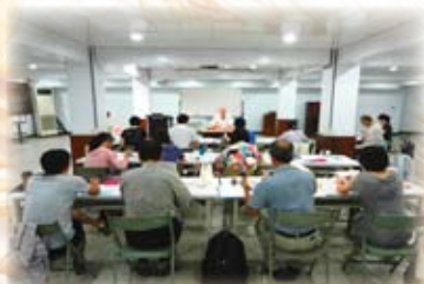
2012暑期學分班-書信及啟示錄