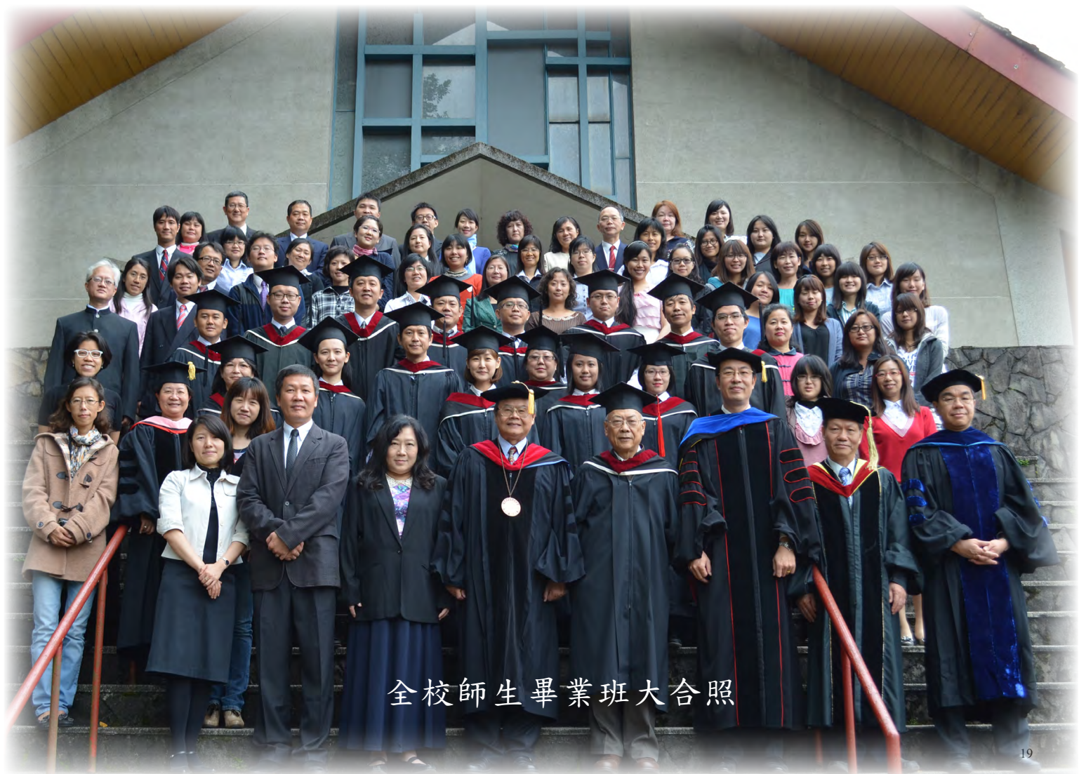
全校師生畢業班大合照