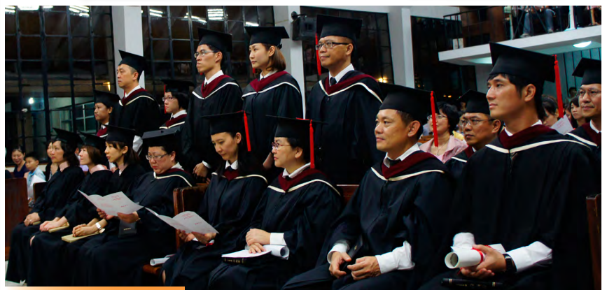
首屆6名神道學碩士畢業