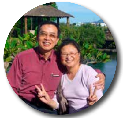
文 / 柳健台 牧師