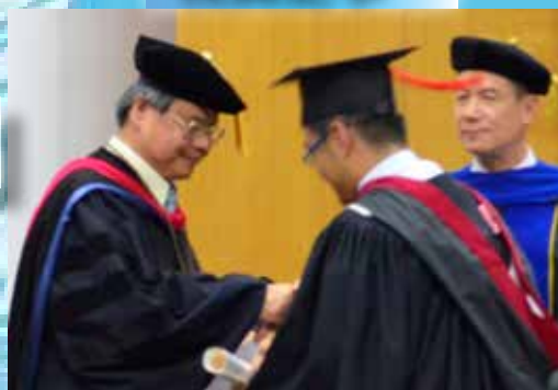
102學年度開學典禮及第65屆畢業典禮