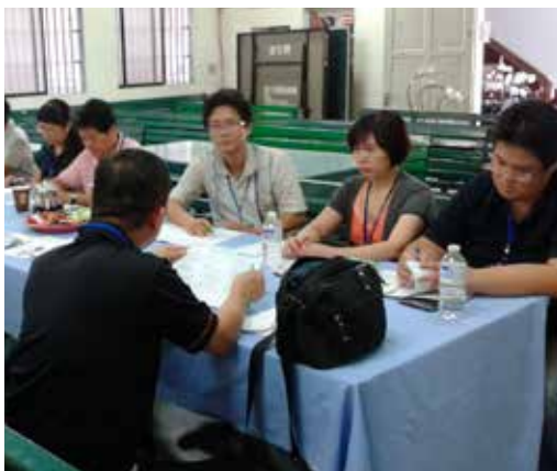
9/6日五院聯誼：客神、浸神、衛神、浸宣、基層五校聯誼，這次在客神舉辦，分五組：辦校理念、學生輔導與實習、課程設計與師資交流、圖書資源、推廣教育與公關企劃等專題研討。中午由客神作東請大家在新竹聚餐。