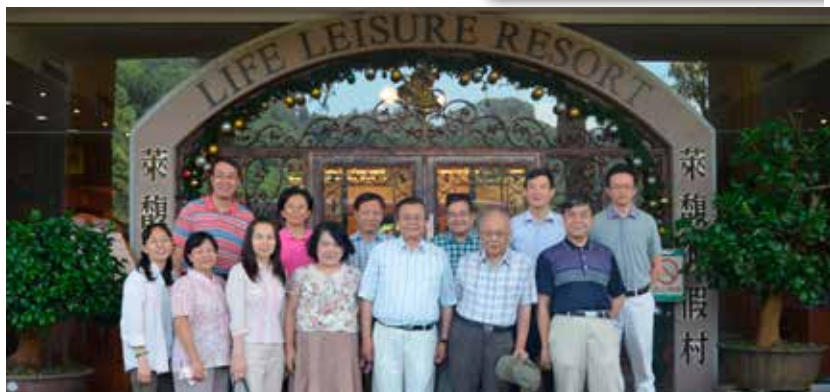
教師暨行政主管退修會