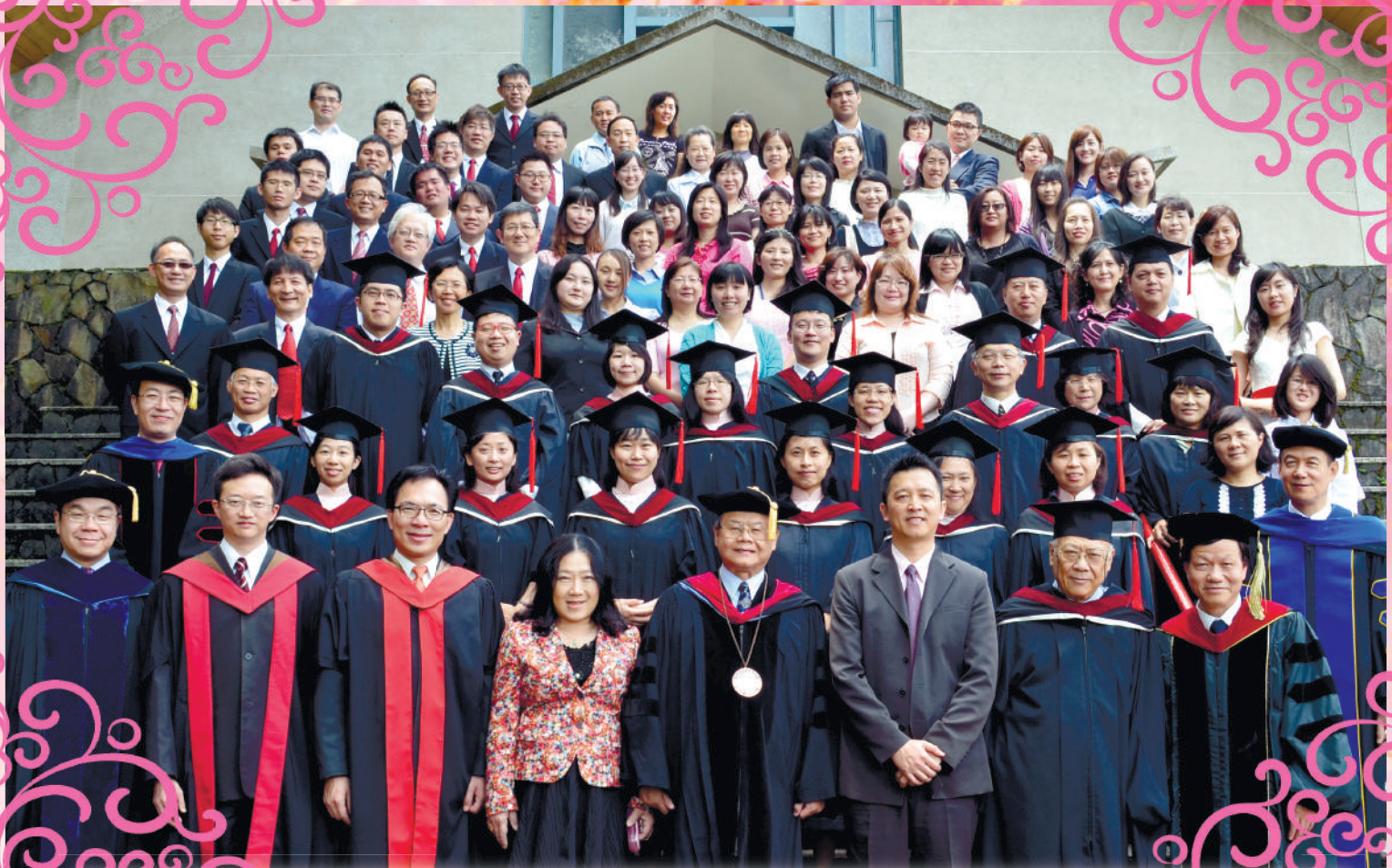
浸神全體教職員生及畢業生大合照