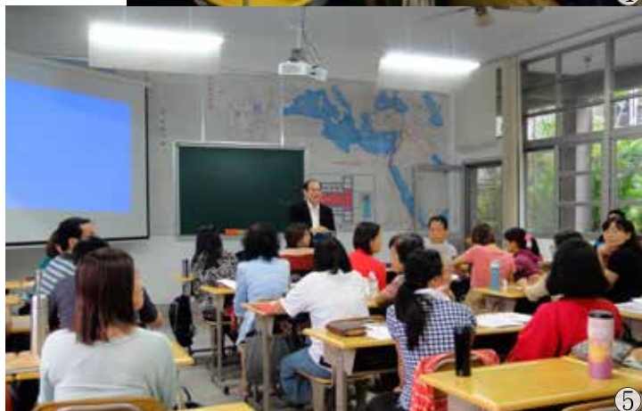
10月27日-10月31日 神學體驗營 圖4、圖5