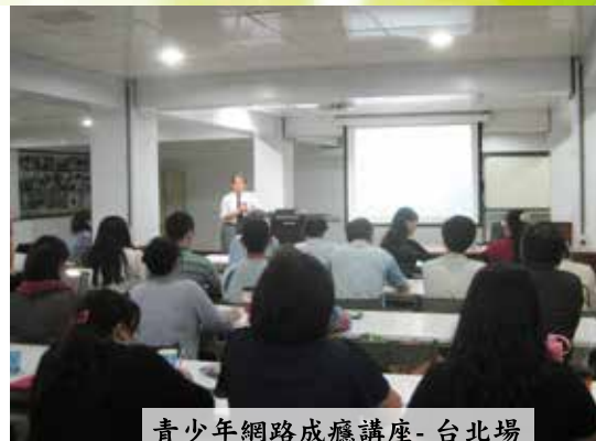
青少年網路成癮講座-台北場

基督教台灣浸會神學院 http://www.tbts.edu.tw/class_oneyear.php