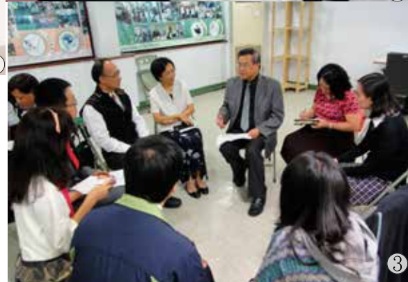
11月17日 全校祈禱會 圖2、圖3