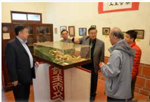
俄羅斯院長來訪，參觀本校歷史資料中心。