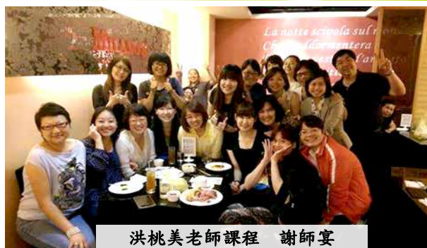
洪桃美老師課程 謝師宴

基督教台灣浸會神學院 http://www.tbts.edu.tw/class_oneyear.php