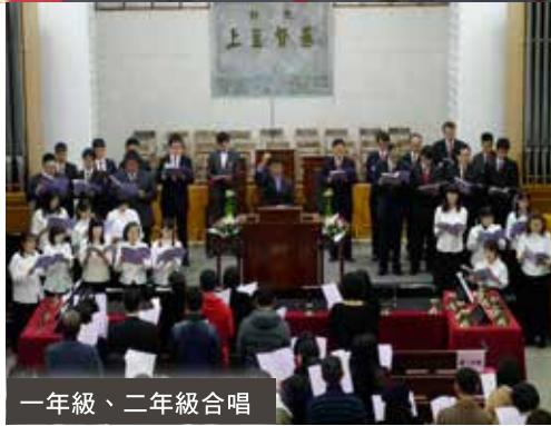
一年級、二年級合唱