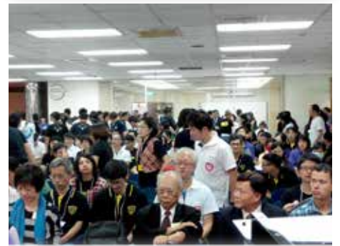
2015六校聯誼於11月21日在衛理神學院舉行

2.為三年級畢業班同學禱告，求神帶領順利完成論文寫作，以及尋求未來的服事禾場代禱。 3.請為學生們寒假生活出入的平安、教會服事順利、身體健康以及家人平安代禱。