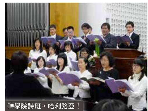
神學院詩班，哈利路亞！