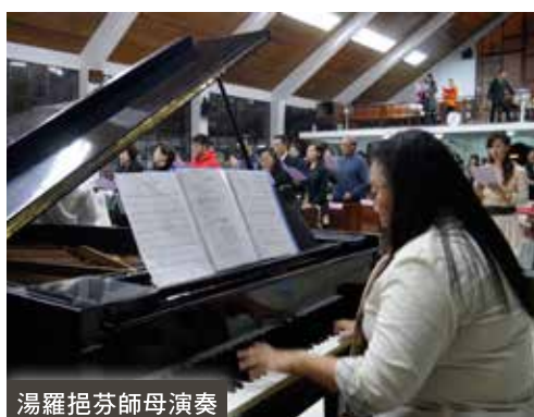
湯羅挹芬師母演奏