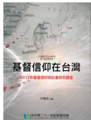
附圖一 基督信仰在臺灣

依據書中的說明，本調查報告是2012年春，由『社團法人中華世紀智庫協會』發起，約請中央研究院社會學研究所伊慶春研究員為召集人，再約集臺灣社會學學界的學者，進行問卷題目設計，再於2012年11月21日至12月17日，每日晚間六點至十點，透由撥接226,093通電話，進行電話問卷調查，再依獲得的資料，經學有專長的學者專家，率領研究生團隊進行統計與分析，得出的資料，再經全是任職任教於公立研究機構與公私立大學學者，分別就相關的議題寫出解讀論文，再召開學術研討會 3 ，接受各界的評論，最後經修正後，集結成書，於2014年09月出版於臺北。本報告堪稱是臺灣第一次對『基督信仰與社會研究調查』的學術調查報告，其貢獻誠如本研究報告主持人伊教授在本書前言之末所歸納的，共有四項：