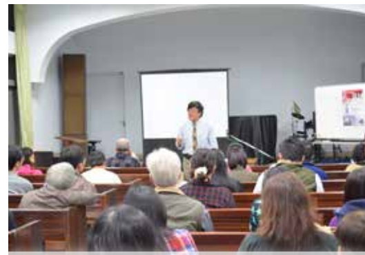
溫司卡教授學術演講會