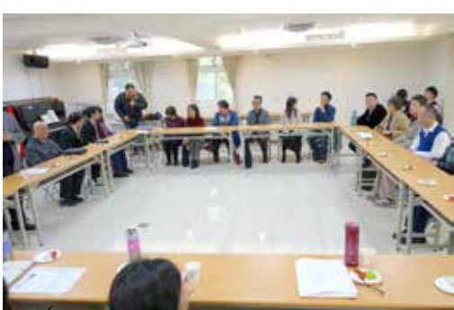
竹苗區 3/7 同工研討會