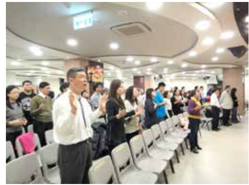
北5區 3/21 培靈會