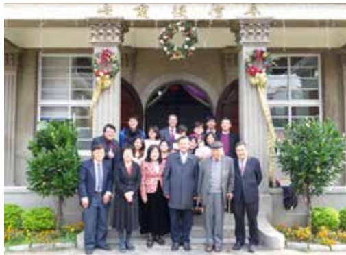
台南區1/17 同工聯誼合影

E-mail : ard@tbts.edu.tw 電話：02-2720-3140 分機 145