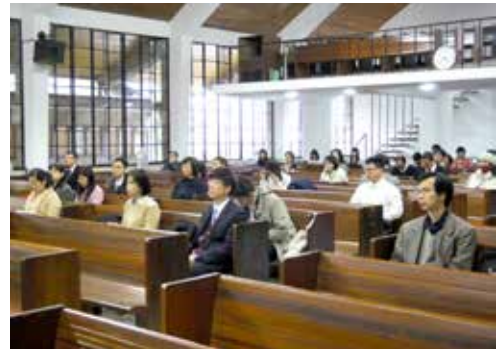
現場同學聚精會神聆聽神學講座