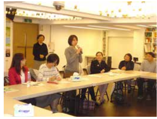
北2區 3/14 摩利亞團契