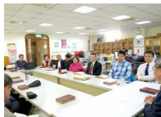
雲嘉區 1/19 同工聯誼