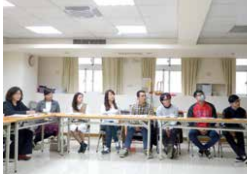
竹苗區 3/7 摩利亞團契