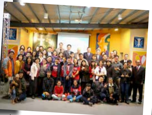
台東區 1/30 同工與摩利亞團契大合照