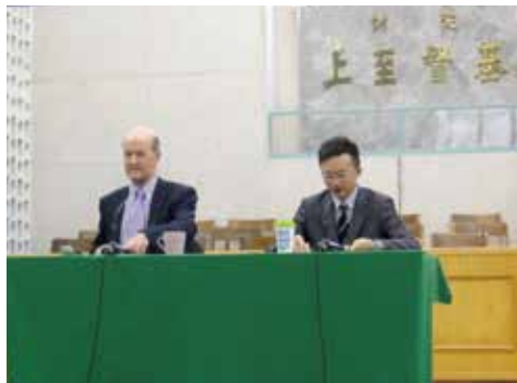
英國愛丁堡大學神學院院長大衛·弗格森教授 「基督教神學：21世紀的挑戰」神學講座