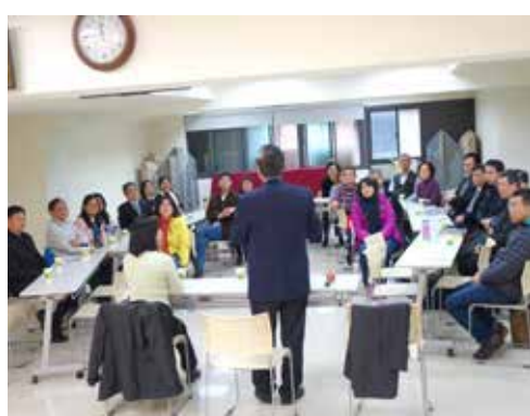
北東區 2/7 同工聯誼