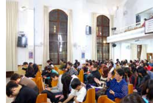
竹苗區 3/7 培靈會