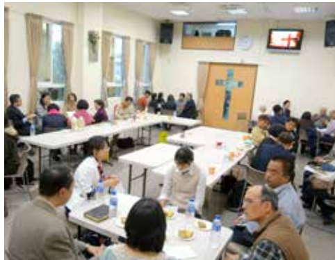
台東區 1/30 同工聯誼