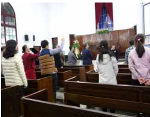
雲嘉區 1/19 培靈會