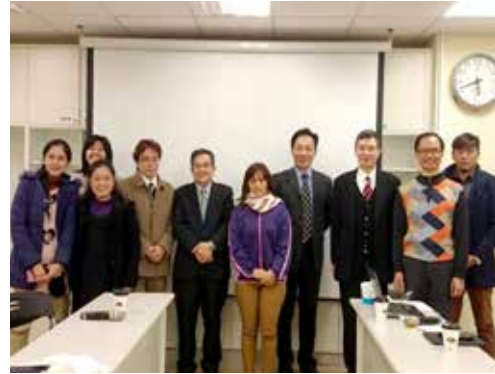
花蓮 2 區 1/31 摩利亞團契