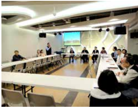
北5區 3/21 同工聯誼