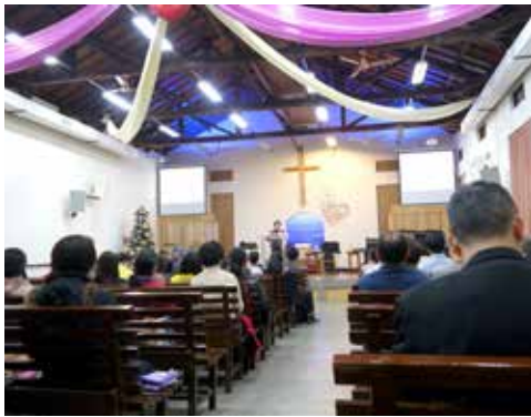
台南區 1/17 培靈會