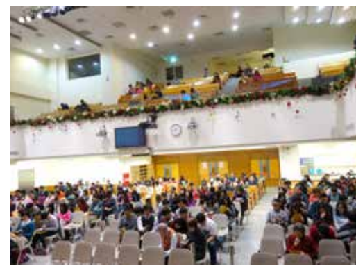
花蓮1區 1/31 培靈會