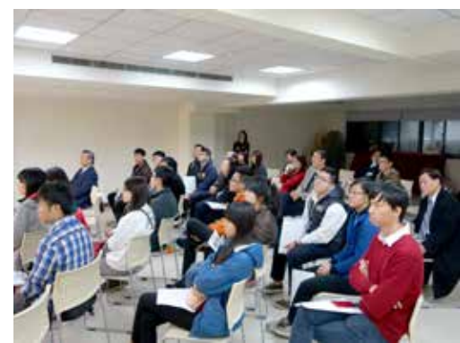
北東區 2/7 摩利亞團契