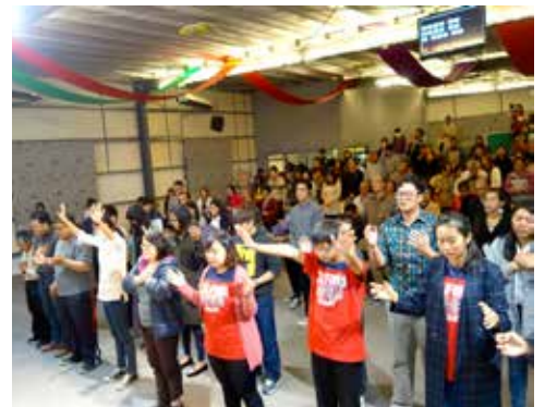
台東區 1/30 培靈會