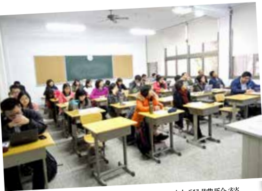
3月24日-27日神學體驗營