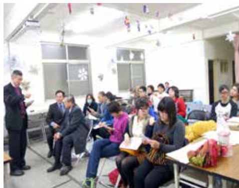
台南區 1/17 摩利亞團契