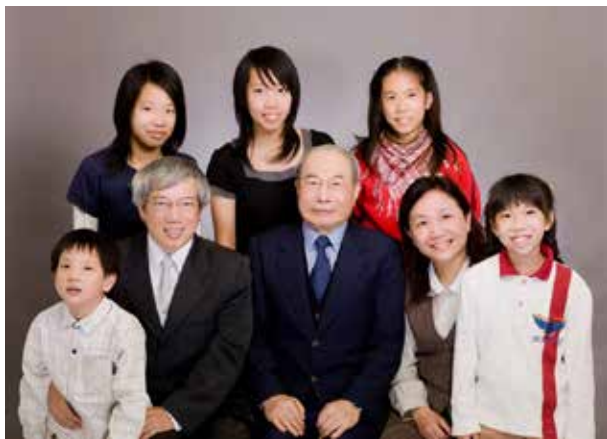
文 / 黃榮村 · 道碩一