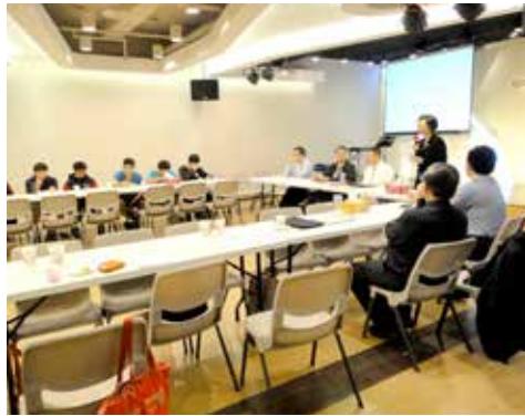
北5區 3/21 摩利亞團契