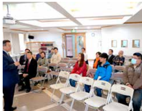
雲嘉區 1/19 摩利亞團契