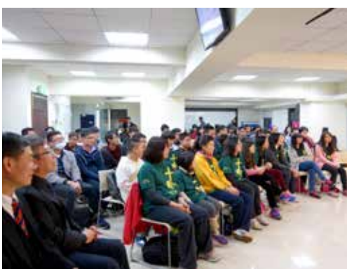
北東區 2/7 培靈會