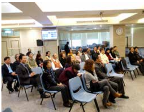
花蓮1區 1/31 同工聯誼