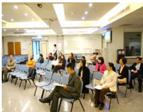
花蓮1區 1/31 摩利亞團契