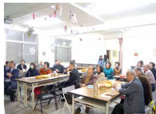
台南區 1/17 同工聯誼