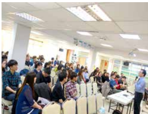
北6區 3/28 摩利亞團契