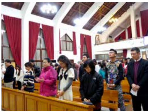
高屏區1/24 舉行培靈會