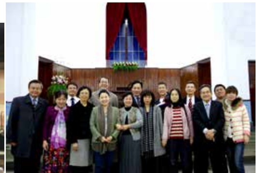
雲嘉區1/19 同工聯誼合影