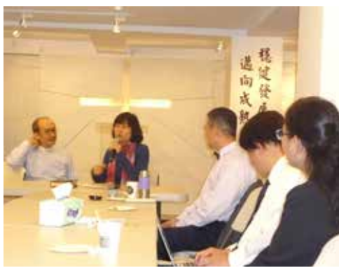
北2區 3/14 同工聯誼