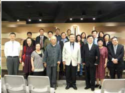
北5區 3/21 同工聯誼合影