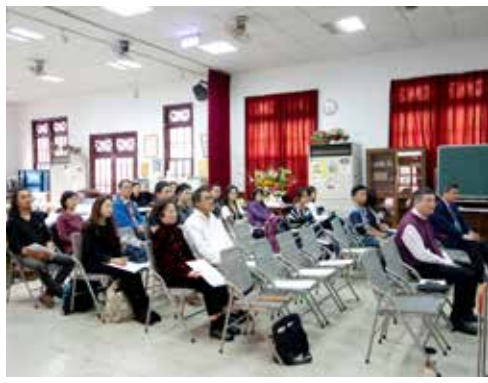
高屏區 1/24 摩利亞團契