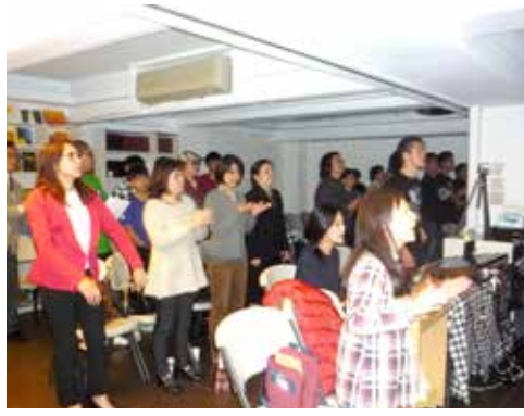
北2區 3/14 培靈會