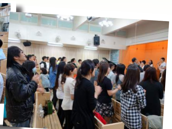
中桃區 5/2 培靈會