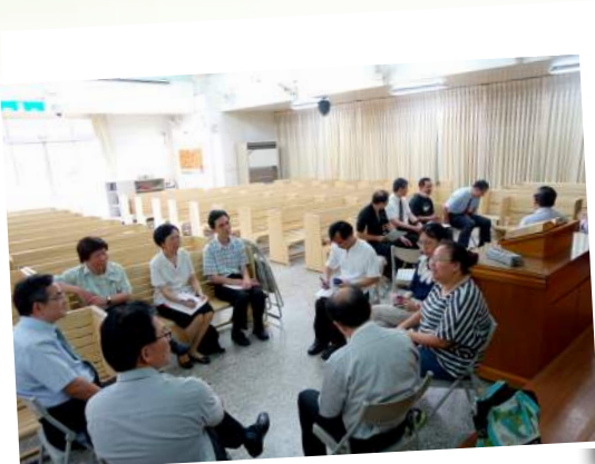
中桃區 5/2 同工聯誼

E-mail : ard@tbts.edu.tw 電話 : 02-2720-3140 分機 145