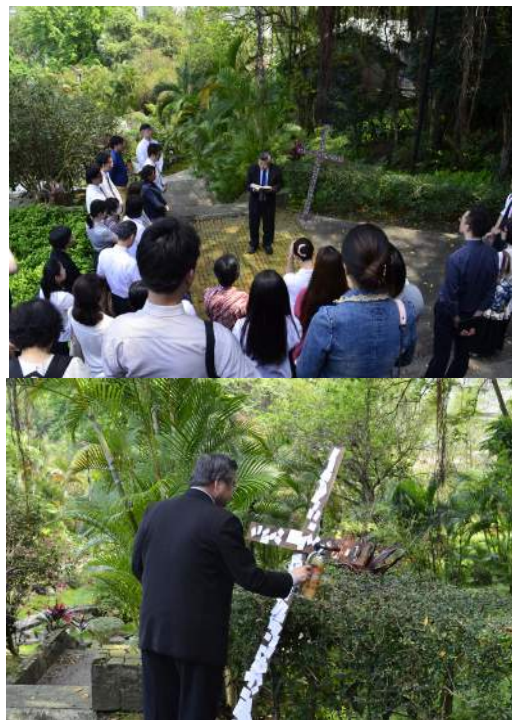
2015年4月2日舉行全校受難節祈禱日

本院於4月16日邀請中國內地會同工至本院理培堂表演舞台劇「落在土裡的麥子」，現場除了本院師生外，另有校外人士一同參與，約有150位觀眾。