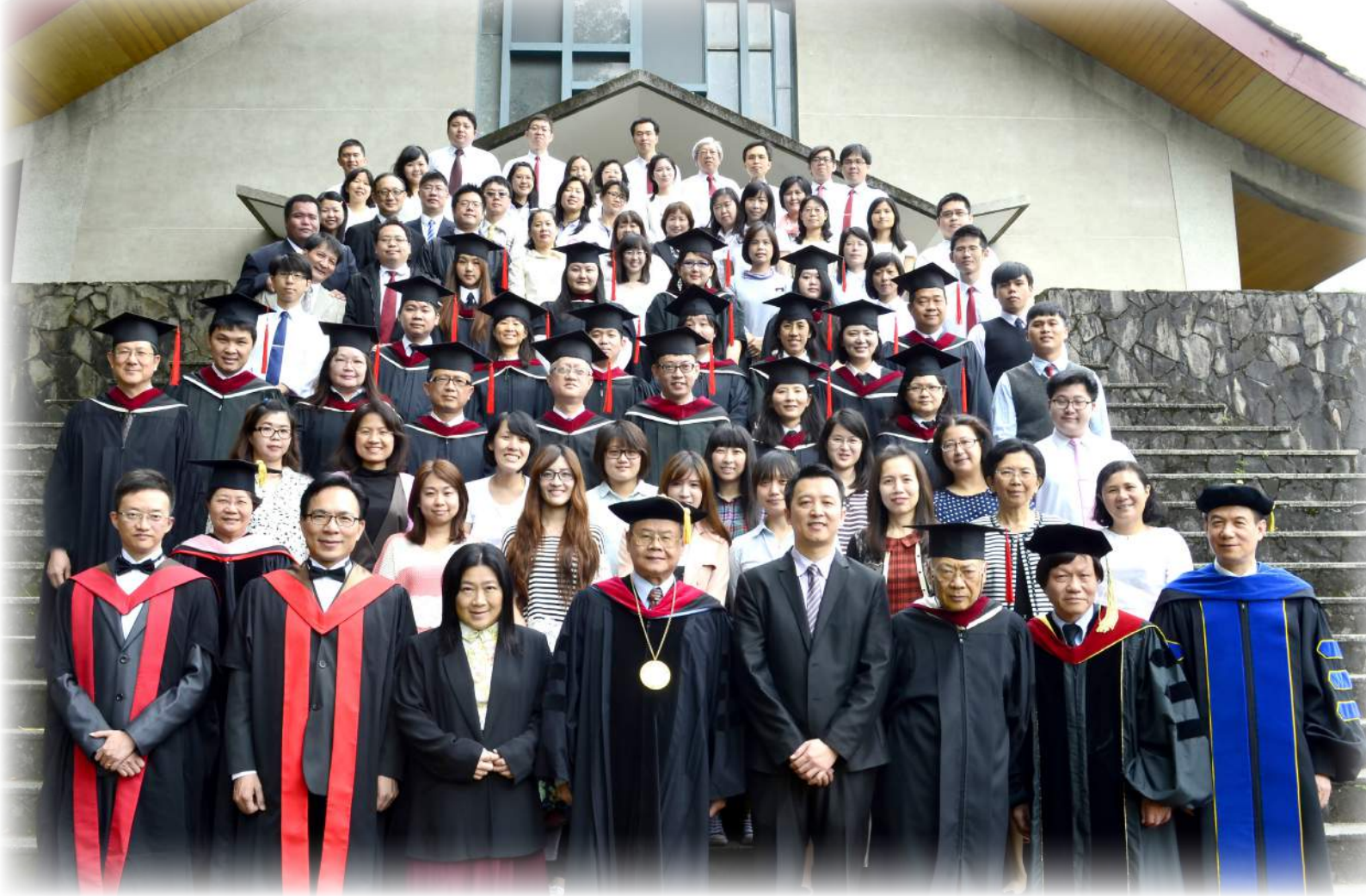
台灣浸神全體教職員生暨畢業生合影留念