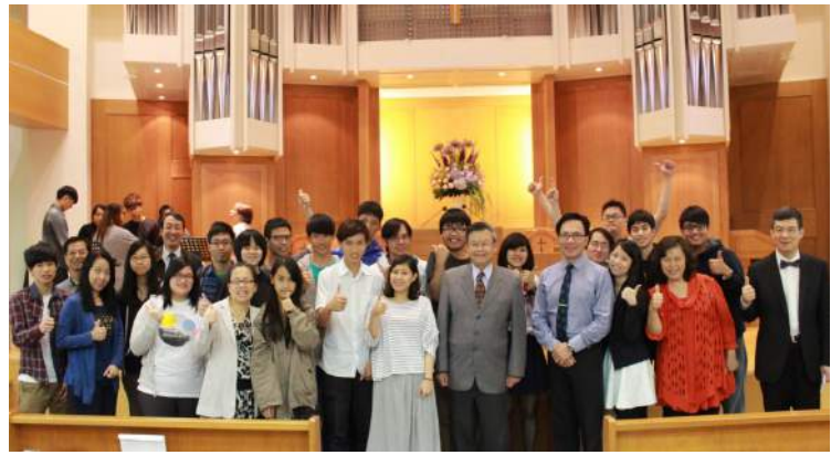
北四區4/19與義美堂會友合影

學術研究價值，遂採雙向匿名審稿制度；《2016浸神學刊》截稿日期為2016年4月30日。在此竭誠邀稿，歡迎海內外各大學、神學院及相關科系學者、教授、神學生將您研究的學術作品踴躍賜稿，一般論文字數約10000-20000字；英文5000-10000字；學術動態、學術論評2000-5000字。書寫格式可參考本中心網頁公布之稿例為之，一經核稿即可刊登。