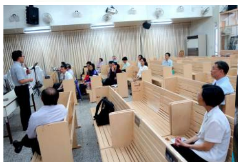
中桃區 5/2 摩利亞團契