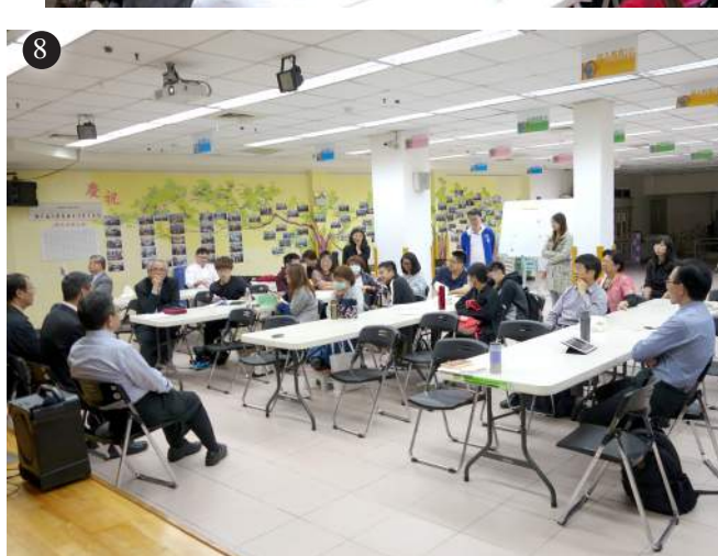
圖1 中彰投區4/11 同工聯誼 圖2 中彰投區4/11摩利亞團契 圖3 中彰投區4/11 培靈會 圖4 北1區4/18 同工聯誼 圖5 北1區4/18 培靈會 圖6 北4區4/25 同工聯誼 圖7 北4區4/25 培靈會 圖8 北4區4/25 摩利亞團契