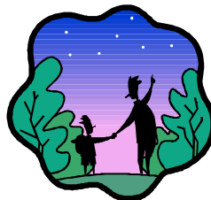
全教會四十天連鎖禁食禱告輪值表

全教會四十天連鎖禁食禱告，將於7月9日（主日）展開，請弟兄姊妹預備禁食的心，在自己的行事曆上記下小組禁食日期，確實為每一位認領的朋友守望禱告，讓我們都加入屬靈禁食禱告的行列！跟上大復興的浪潮！