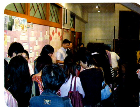
會眾踴躍地在書攤選購各種產品