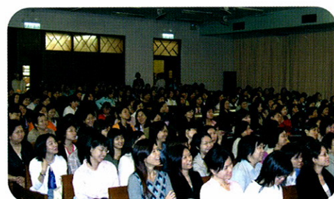
會眾醉心於講員的分享