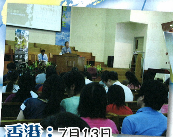
香港：7月13日 「最美的事奉」教牧講座