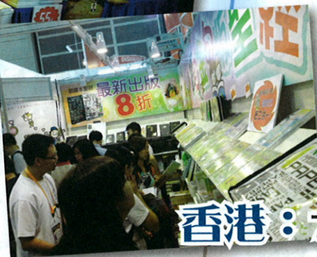
香港：7月22 - 28日「香港書展」