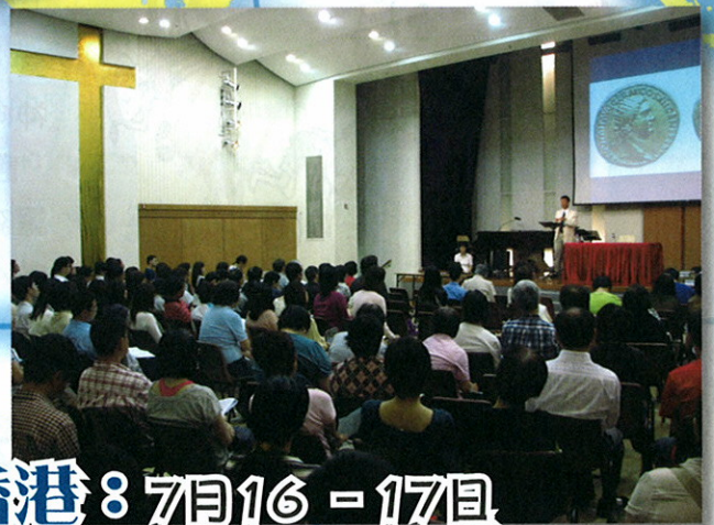
香港：7月16 - 17日 「來看約翰的異象」聖經講座