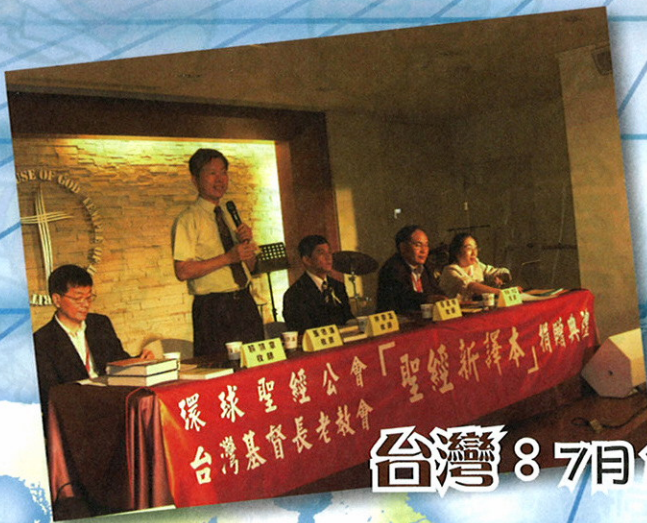
台灣：8月17日「台灣基督長老教會贈經」