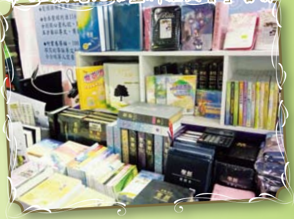
香港：8月1至10日 「第82屆港九培靈研經大會」書攤