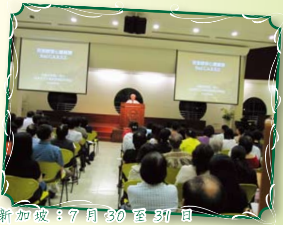
新加坡：7月30至31日 「從聖經看心靈關懷」專題講座