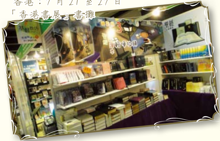
香港：7月21至27日 「香港書展」書攤