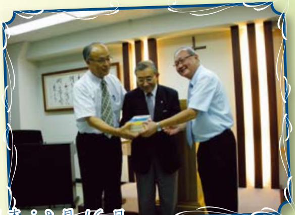
日本：8月16日 《新約聖經——日中對照版》發布會