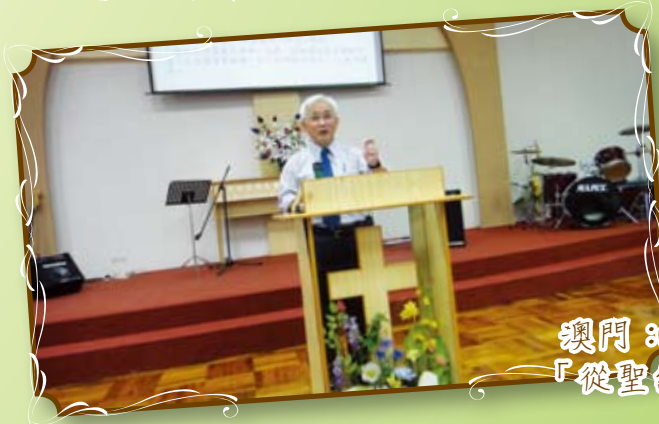
澳門：8月30日 「從聖經看心靈關懷」專題講座