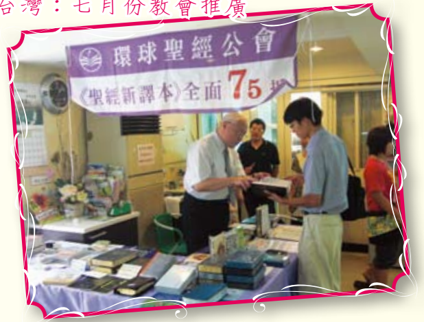
台灣：七月份教會推廣