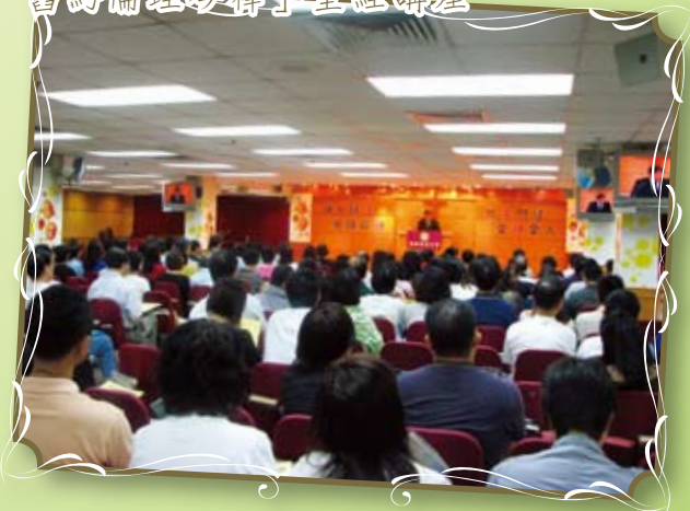
香港：9月17至18日 「舊約倫理今釋」聖經講座