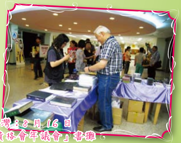
台灣：8月16日 「貴格會年議會」書攤