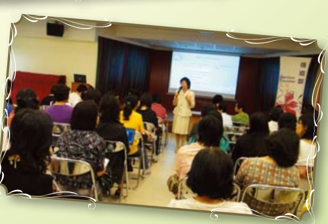
香港：7月23至24、26日 「從聖經看全人關懷」專題講座和工作坊