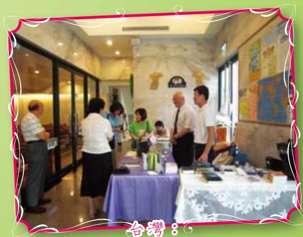
台灣： 九月份教會和神學院書攤推廣