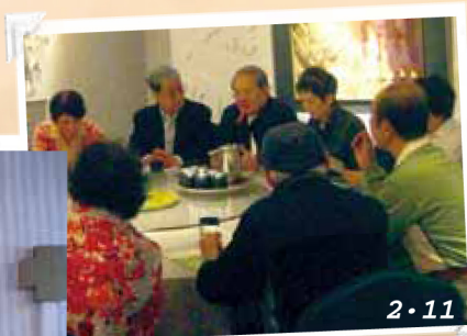
“第三屆第一次會員大會”