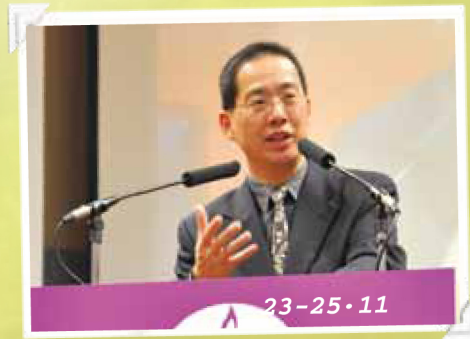
“猶太節期的神學意義——從紀念到歡慶” 聖經講座 (講員：鮑維均博士)