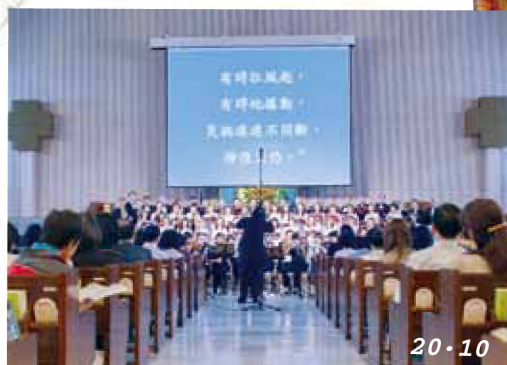
“台灣環聖十週年慶典感恩音樂會‘歡慶與豐收’”