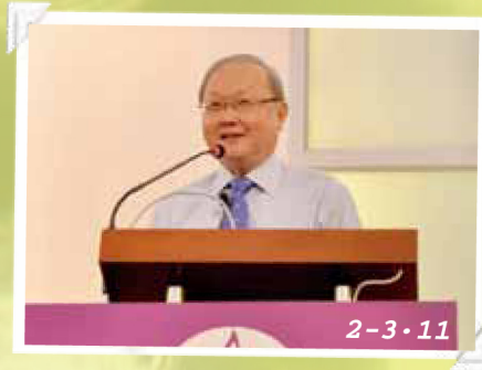
“亦僕亦友：從腓立比書看事奉與喜樂” 聖經講座 (講員：黃朱倫博士)